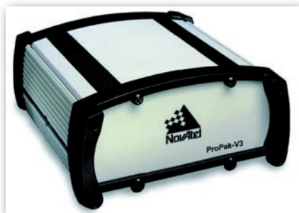
Rys. 3. Odbiornik NovAtel ProPak-V3