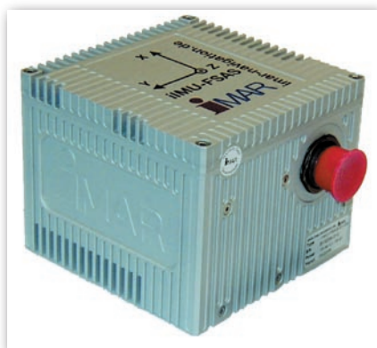
Rys. 4. Jednostka IMU - FSAS