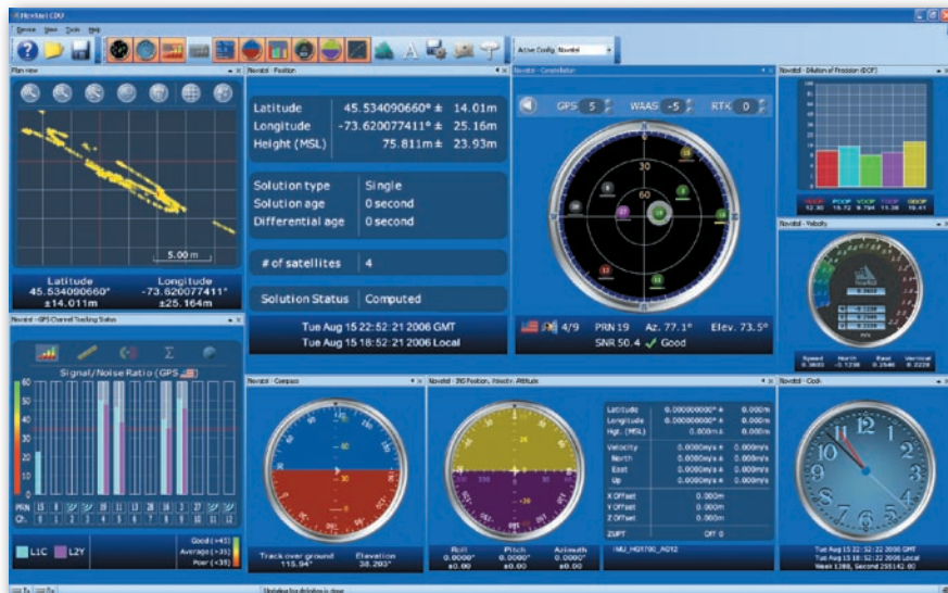
Rys. 5. Panel kontrolny systemu SPAN

która nie jest objęta ograniczeniami eksportowymi USA i może być swobodnie przewożona na terenie UE. Opcjonalnie możliwy jest postprocessing danych w programie NovAtel Inertial Explorer. Postprocessing pozwala na korekcję różnicową danych z plikami RINEX, korekcję PPP (Precise Point Positioning) z plikami efemeryd precyzyjnych oraz korekcję błędów jednostki IMU poprzez odwrócenie strzałki czasu w obliczeniach, co pozwala na dalsze zwiększenie dokładności zbieranych danych lokalizacyjnych.