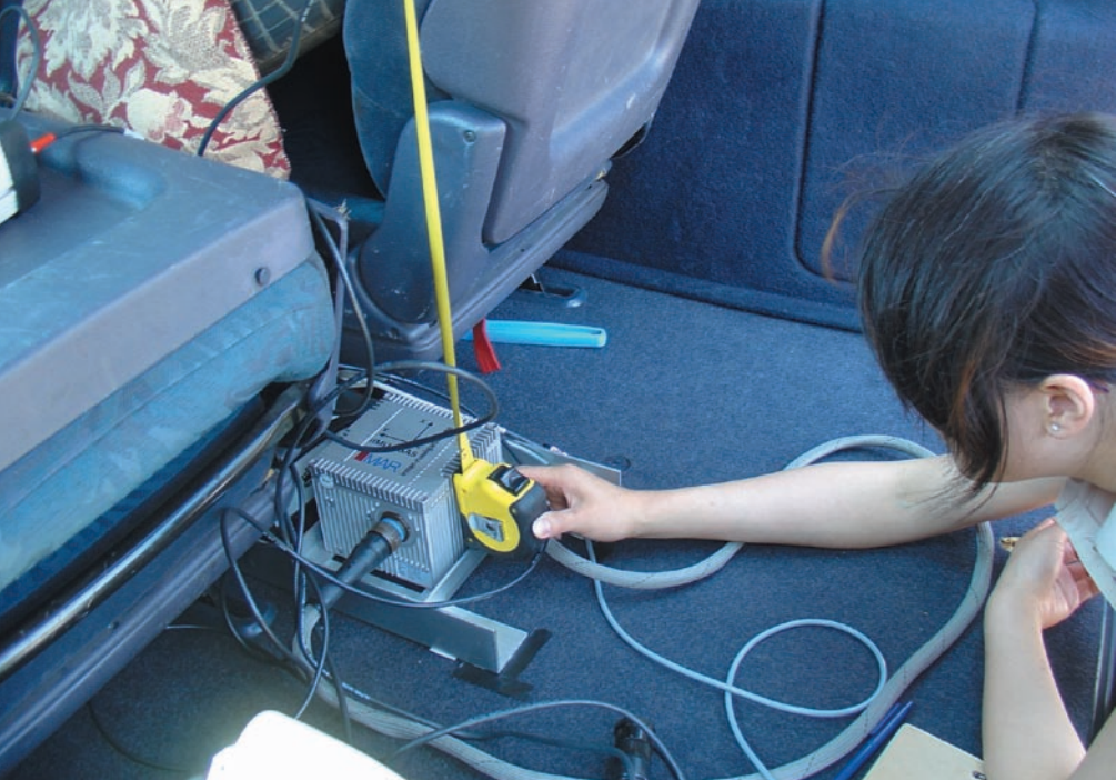
Rys. 6. Kalibracja wstępna systemu